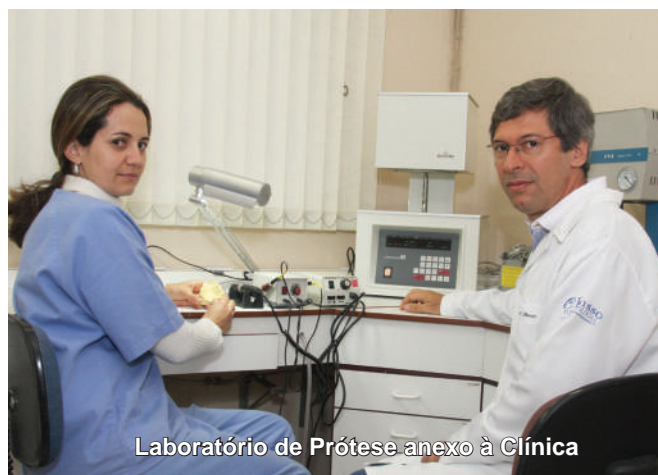
Laboratório de Prótese anexo à Clínica

É importante ressaltar que, nos últimos 20 anos a Russo Odontologia tem direcionado suas atividades para a área de reabilitação oral, com grandes investimentos na área de implantodontia, estética, prótese laboratorial especializada em porcelana. "Recentemente, agregamos a nossa rotina a atuação na área de halitose, sempre com o suporte de cursos de aperfeiçoamento e congressos", completa.