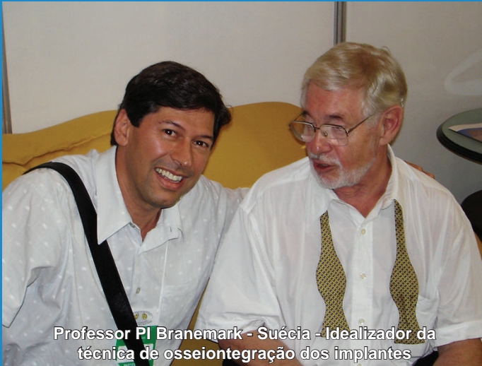
Professor PI Branemark - Suécia - Idealizador da técnica de osseointegração dos implantes